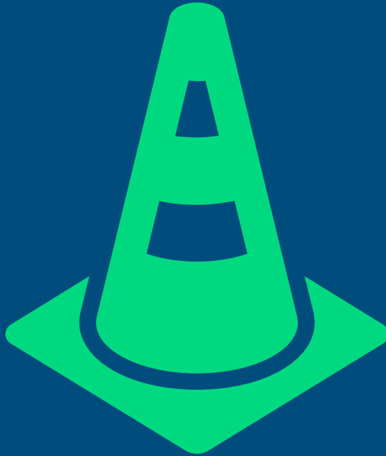
Schéma directeur & livre blanc

Coordination avec les projets des communes